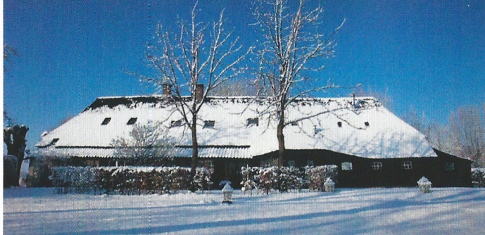
De boerderij in de winter.