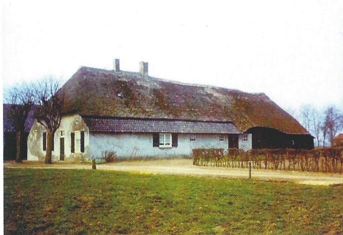
De boerderij in het voorjaar.

V lak bij de Kampina en de Kleine Aa ligt onze eeuwenoude boerderij. 'Wat moet je met zo'n oude knip?' zei iedereen tegen ons toen wij deze boerderij in 1971 kochten. 'Ik zou 'm omstoten en er iets nieuws neerzetten.'