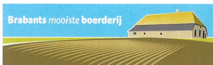
Hof van Vijfeijken: meer mensen dan al die tijd ervoor.

In de eerste winter zaten we rond het vuur onder de schouw in de herd, want we hadden nog geen verwarming. Het vroom buiten en dan besef je ineens dat hier al generaties lang lief en leed is gedeeld. Voor het slapen gaan zaten ze daar te praten of stil te